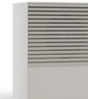
NEBBIA (RAL 9018)