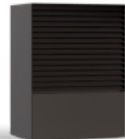
NERO (RAL 8019)