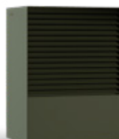
OLIO (RAL 6003)