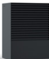
ANTHRACITE (RAL 7016)